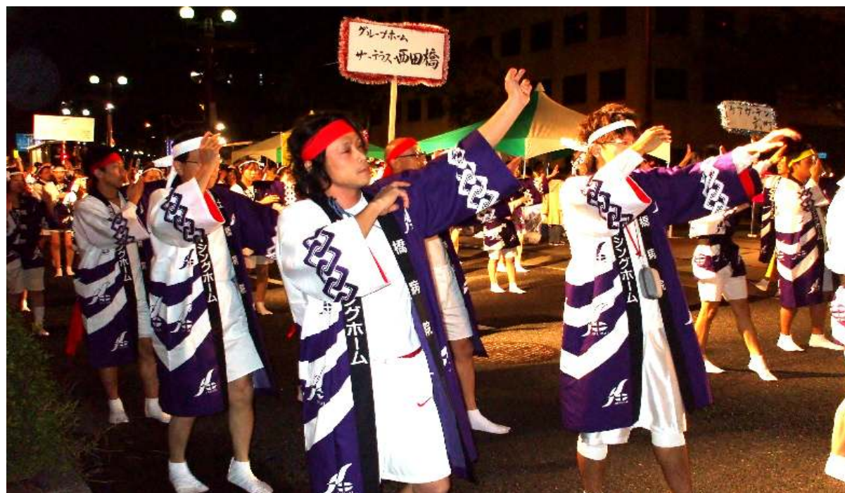
<平成22年度 おはら祭り 前夜祭にて>