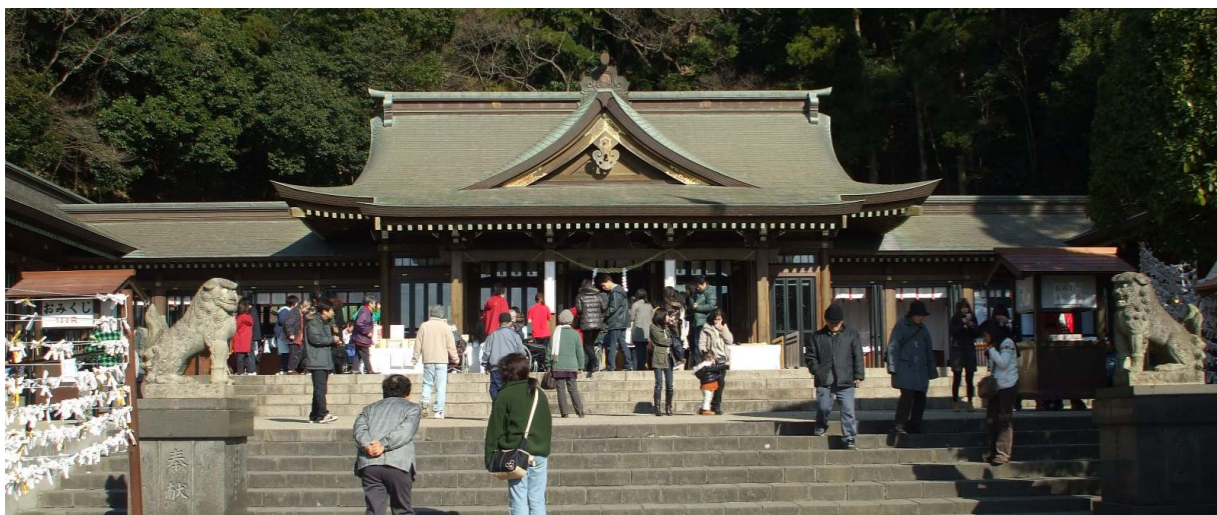
< 平成23年初詣の風景 護国神社にて >